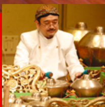
クト・クンピャン